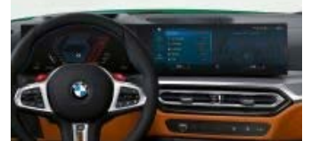
BMW ライブ・コックピット・プラス