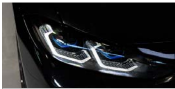
M ライトシャドーライン