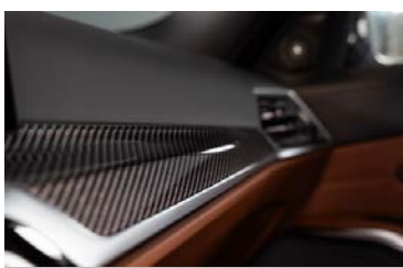
M カーボン・ファイバー・トリム