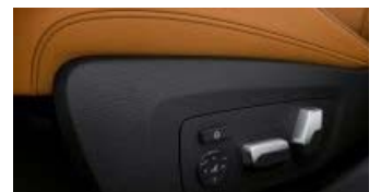
アクティブ・ベンチレーション・シート (運転席&助手席)