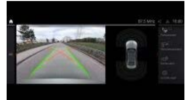
パーキング・アシスト