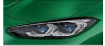
BMWレーザー・ライト