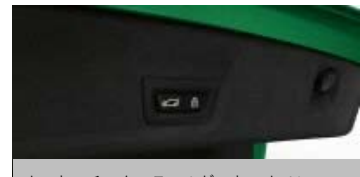
オートマチック・テールゲート・オペレーション