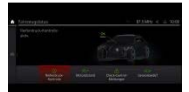
タイヤ空気圧モニタリング・システム