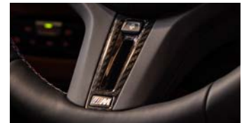
ステアリング・ホイール・ヒーティング