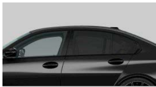
サンプロテクション・ガラス